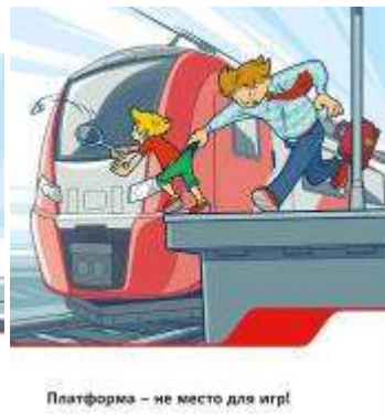
Платформа - не место для игр!

Приближаясь к железной дороге - снимите наушники - в них можно не услышать сигналов поезда!