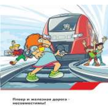
Плеер и железная дорога - несовместимы!